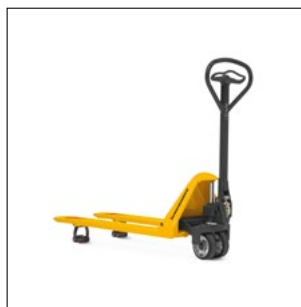
Konstant smurte forbindelser sikrer vedligeholdelsesfri brug