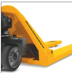
Flade, stabile gafler