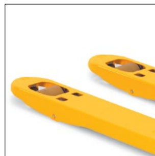
Afrundede gaffelspidser til en let indskubning i pallen