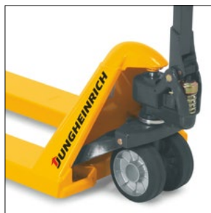
Konstant smurte forbindelser sikrer vedligeholdelsesfri brug