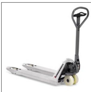
AM G20 - korrosionsbeskyttelse takket være galvanisering