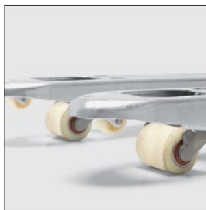
Afrundede gaffelspidser til en let indskubning i pallen