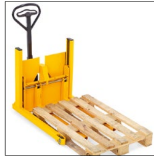
Optag af en standard-europalle