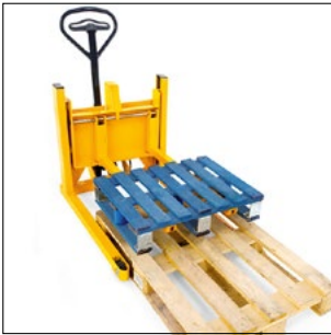
Aftagning af en halv palle fra en standard-europalle