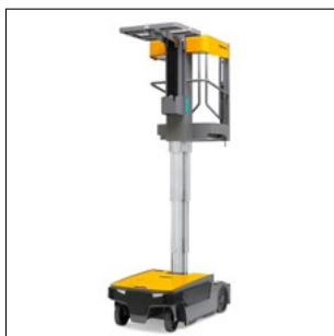
Sikker selv i store højder