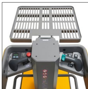
Altid overblik over betjeningssementer og plade.