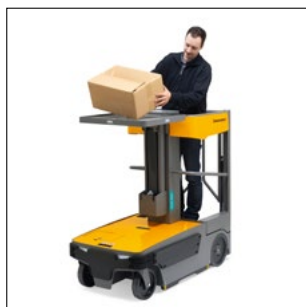
Plade med masser af plads