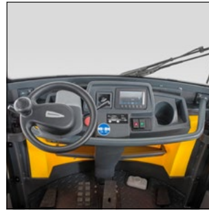
Overskuelig placering af alle betjenings- og displayelementer