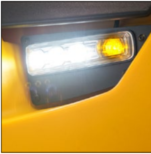
Robust LED belysning (option)