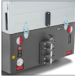
Mulighed for forskellige koblinger (option)