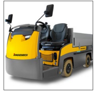
Fås også uden kabine